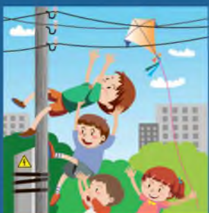
Нельзя играть вблизи линий электропередачи!