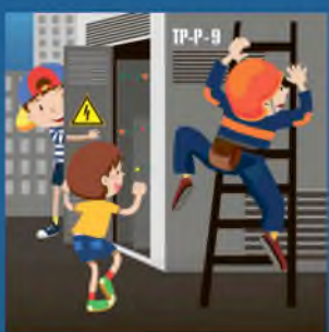
Нельзя открывать двери трансформаторных подстанций!