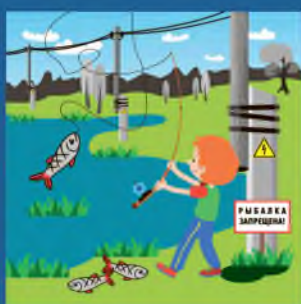
Нельзя ловить рыбу рядом с линией электропередачи!