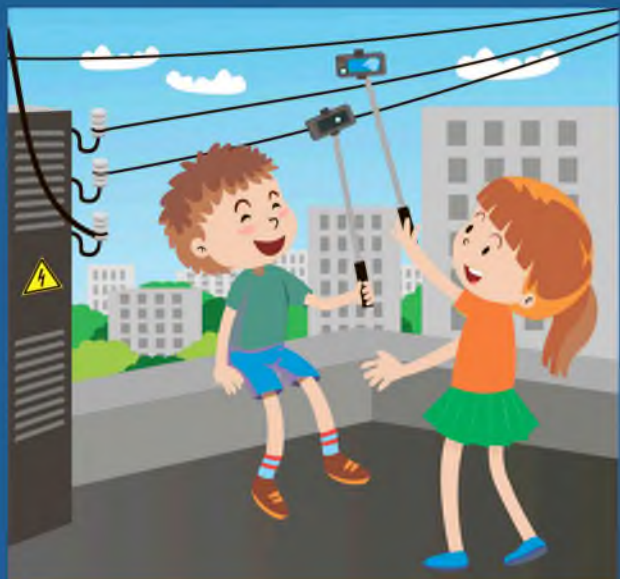
Нельзя использовать палку для селфи рядом с электрооборудованием и линиями электропередачи!

Обращаем ваше внимание на необходимость соблюдения правил поведения вблизи энергообъектов! Линии электропередачи и иные электроустановки – источник повышенной опасности! В зоне риска – наши дети! Энергетики убедительно просят вас, уделите пять минут и прочитайте вместе со своими детьми основные правила электробезопасности!